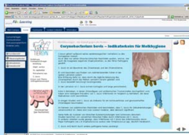
Abb. 1: Screenshot der Internetseite

Studiengangs Veterinärmedizin der FU Berlin. Insgesamt besuchten 81 Studierende (28,3%) die Internetseite. Davon nahmen 64 Studierende (22,4%) an einer Online-Befragung teil. Mit der Online - Befragung